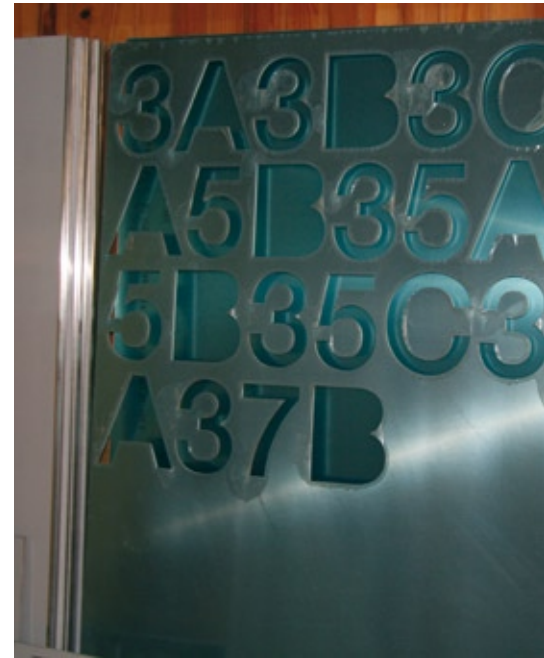
Hohl verarbeitet Aluminium, Kunststoff und Edelstahl genauso wie ...

tet und nach fünf Minuten lag ein perfekt geschnittenes Teil auf dem Tisch. In dem Moment war klar: Das ist unsere Maschine. Omax mag ein bisschen teurer sein als andere, aber das Ergebnis zählt. Wenn die Software und die ganze Anbindung nicht funktioniert, hilft uns doch die schönste und günstigste Maschine nichts.“