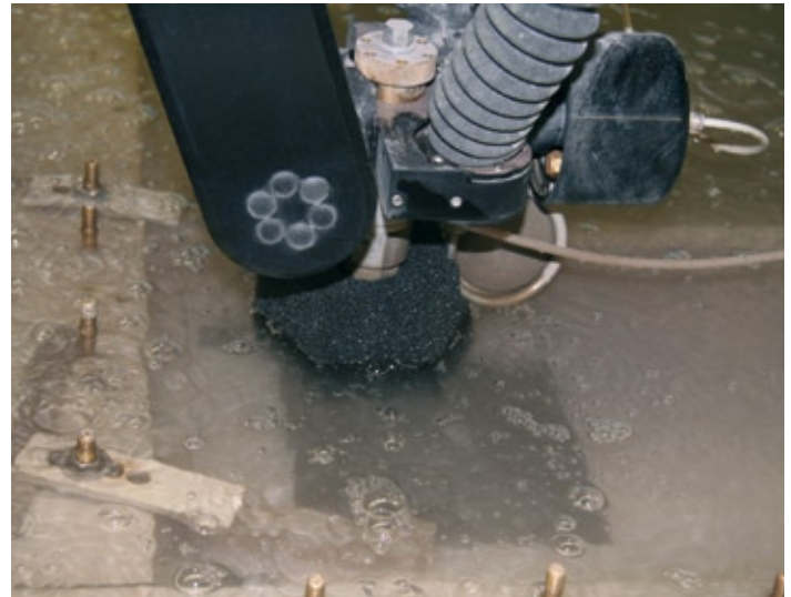
Die von Hohl wasserstrahl-geschnittenen Teile überzeugen durch absolute Passgenauigkeit, woran der besondere Schneidkopf, der eine absolut senkrechte Schnittkante erlaubt, wesentlichen Anteil hat.

lichkeiten zur Herstellung von Buchstaben gibt es wie Sand am Meer, wir wollten aber ein Verfahren, das optimal zu unserem Unternehmen passt. Wir haben uns mit dem Fräsen beschäftigt, dem Laserschneiden und dem Wasserstrahlschneiden. Mal lag das eine Verfahren vorn, mal das andere. Der Laser kam letztendlich nicht in Frage, da er die Buchstaben an der Schnittkante verbrennt und nicht alle unsere Materialien schneiden kann. Denn wir verarbeiten Messing und Bronze genauso wie Aluminium, Edelstahl oder Kunststoff. Auch das Fräsen passt nicht zu unseren Produkten, denn mit einem Fräser haben wir Probleme bei den vielen engen Kanten und Ecken. So hat sich das Wasserstrahlschneiden als beste Lösung herauskristallisiert, mit der wir überaus flexibel sind, was Materialien und Konturen betrifft.“