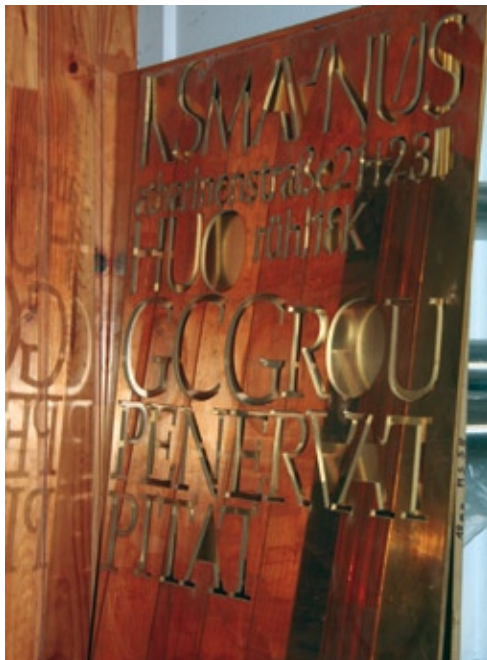
... Messing und Bronze – ein ideales Umfeld für den Wasserstrahl.

in der Region, die bei den Esslingern Teile schneiden lassen und von deren Qualität begeistert sind.